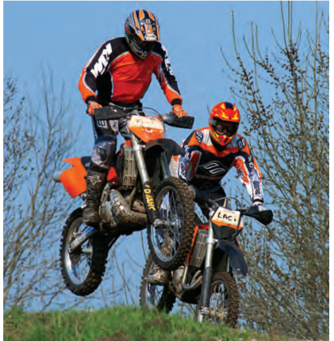
Die Biker des MSC Freising können sich auch in den nächsten fünf Jahren auf ihrem Gelände am Airport in die Lüfte katapultieren.