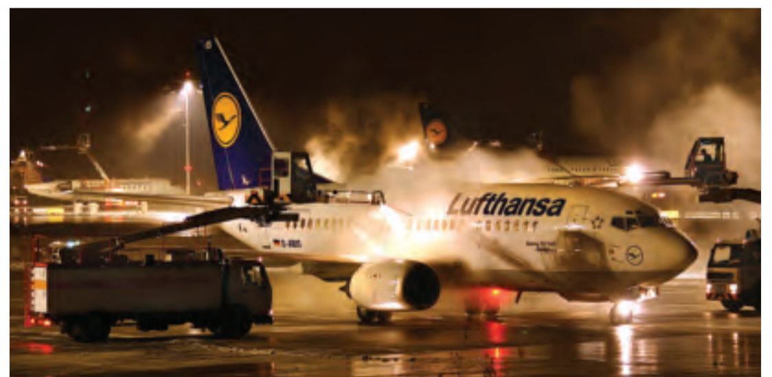
Fast 70 Flugzeuge können die Profis der Gesellschaft für Enteisen und Flugzeugschleppen (EFM) pro Stunde abfertigen.

● Ab 2011 gelten nachts abgesenkte Werte: Der Leq liegt dann bei 50 dB(A) und ein Einzelschallereignis darf 68 dB(A) nicht öfter als sechs mal pro Nacht übersteigen.