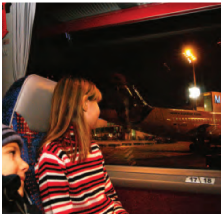
Flughafen live: Während der kalten Jahreszeit können Besucher der Münchner Airports „Lichterfahrten“ übers Vorfeld buchen.

Airport-Tour samt Flugzeugenteisung zum Sonderpreis