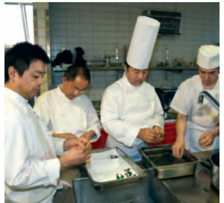
Das Kochteam aus Japan rund um den Starkoch Yutaka Ishinabe (2. v. r.) bei den Vorbereitungen zum Gala-Abend.