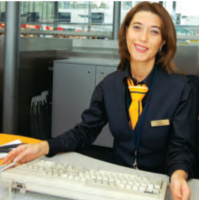
Mit einer innovativen Werbekampagne möchte Lufthansa „die Richtigen finden“.

Lufthansa www.Be-Lufthansa.com , das im Oktober 2002 eingeführt und sukzessive mit neuen Funktionen der Online-Bewerbung erweitert wurde. Mehr als 25.000 Interessenten sind in einem Talente-Pool mit ihrem Qualifikationsprofil registriert. Ein „Karriere-Assistent“ sucht dauerhaft nach offenen Stellen und der Bewerber hat damit die Gewähr, keine für ihn geeignete Position zu verpassen. 95 Prozent aller Bewerbungen erfolgen bei Lufthansa heute online. pm