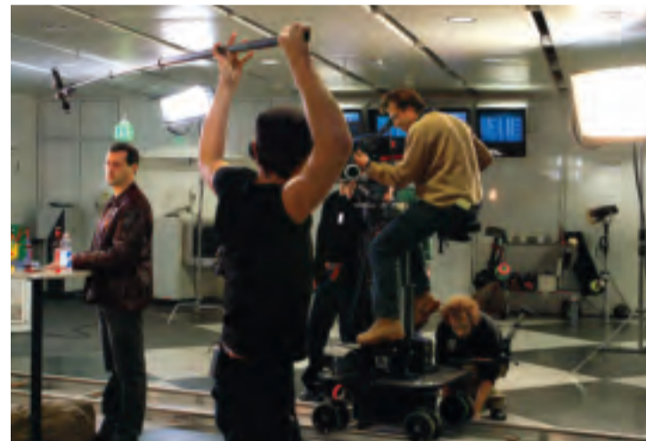
Sechs Tage Rummel im Terminal: Die beliebte Serie SOKO 5113 drehte am Münchner Flughafen die Folge „Stille Nacht – Tödliche Nacht“.

5113 ermitteln aber jede Woche montags um 18 Uhr im ZDF. amo