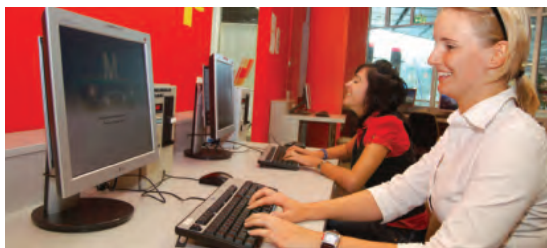
Ob zum Zeitvertreib oder zum Arbeiten: Der iPoint am Münchner Airport sorgt für Kurzweil.

erledigen und die Wartezeit geht schnell vorüber! Zuerst virtuell und dann ganz real rund um die Welt – willkommen am Flughafen München! tg