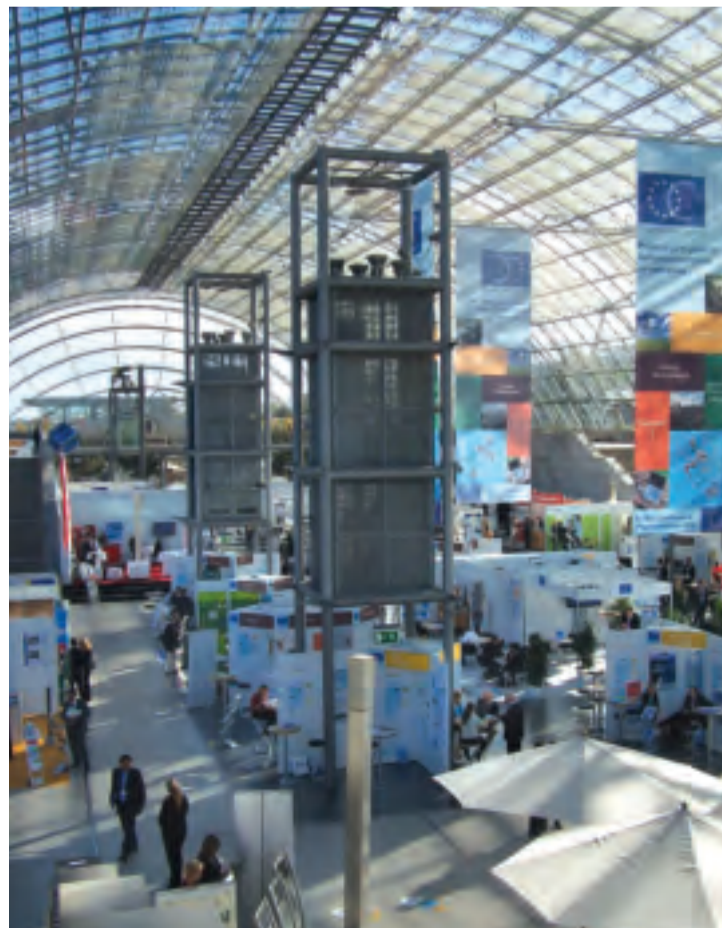
170 Regionen haben sich unter dem imposanten Dach der Messe Leipzig zum Thema Regionalmarketing versammelt.

waren sich die Vertreter der ARGE einig, dass der Aufbau von Partnerschaften mit vergleichbaren Regionen in Deutschland und Europa unbedingt weiterverfolgt werden sollte. cob