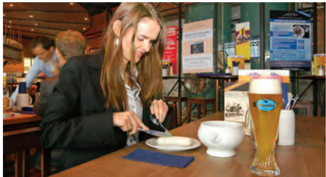
Beliebtes Schmankerl: Im vergangenen Jahr haben die Gäste am Münchner Airport 270 000 Weißwürste verspeist.

Und um eine Abgrenzung gegenüber unseren österreichischen Nachbarn muss sich der Freistaat auch keine Sorgen machen: Mit 240 000 verzehrten „Wienern“ ergibt sich ein respektable 48 Kilometer langer „Wiener-Wurstchen-Äquator“... cf