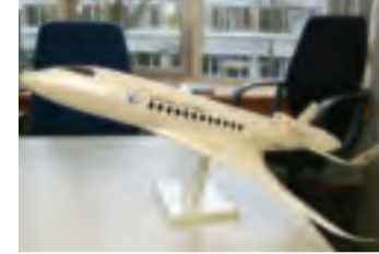
Der „HyLiner“ kann in einer senkrechten Spirale starten.

Frei von unmittelbaren wirtschaftlichen Zwängen forschen die Wissenschaftler nach Lösungen für die Zukunft der Luftfahrt.